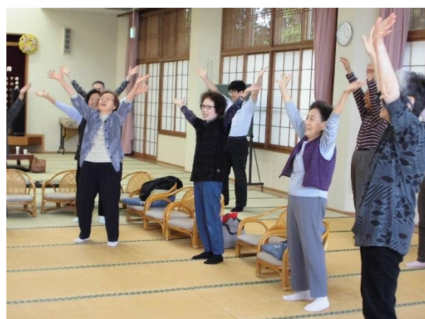
「いいぞ、いいぞ、イエーイ」

今年度ふれあいサロンの内容を一部新しく、アコーディオン演奏や草笛、朗読、フラダンスの方々にお願いしましたので、お楽しみに！！