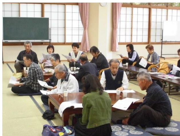
アコーディオン演奏にあわせて